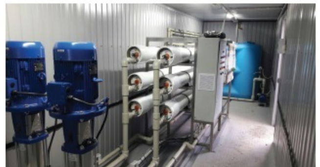
■ Ввод в строй нового оборудования водонапорной башни запланирован на первое апреля

Прогулявшись по улицам и пообщавшись с жителями Целинного сельского поселения, я увидел, как они трудятся на клумбах, обсужда-